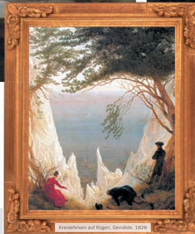
Kreidefelsen auf Rügen, Gemälde, 1828

Caspar David Friedrich wurde 1774 als sechstes von zehn Kindern in der Stadt Greifswald an der Ostsee geboren. Schon früh verlor er Mutter und Schwester. Sein jüngerer Bruder starb 1787 bei einem tragischen Unfall: Beim Schlittschuhlaufen brach Caspar David Friedrich ins Eis ein . Sein Bruder ertrank bei