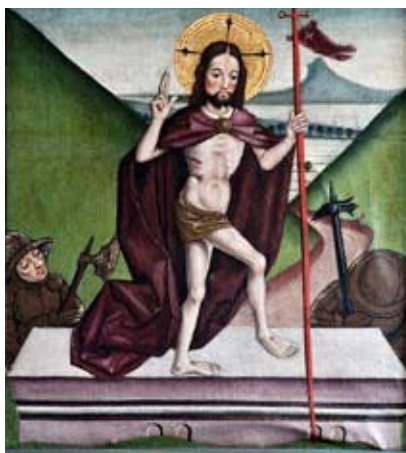
„Der Auferstandene“ (Die Auferstehung Christi), Altaraufsatz, um 1490, Evangelische Kirche Dorffitter (Hessen)