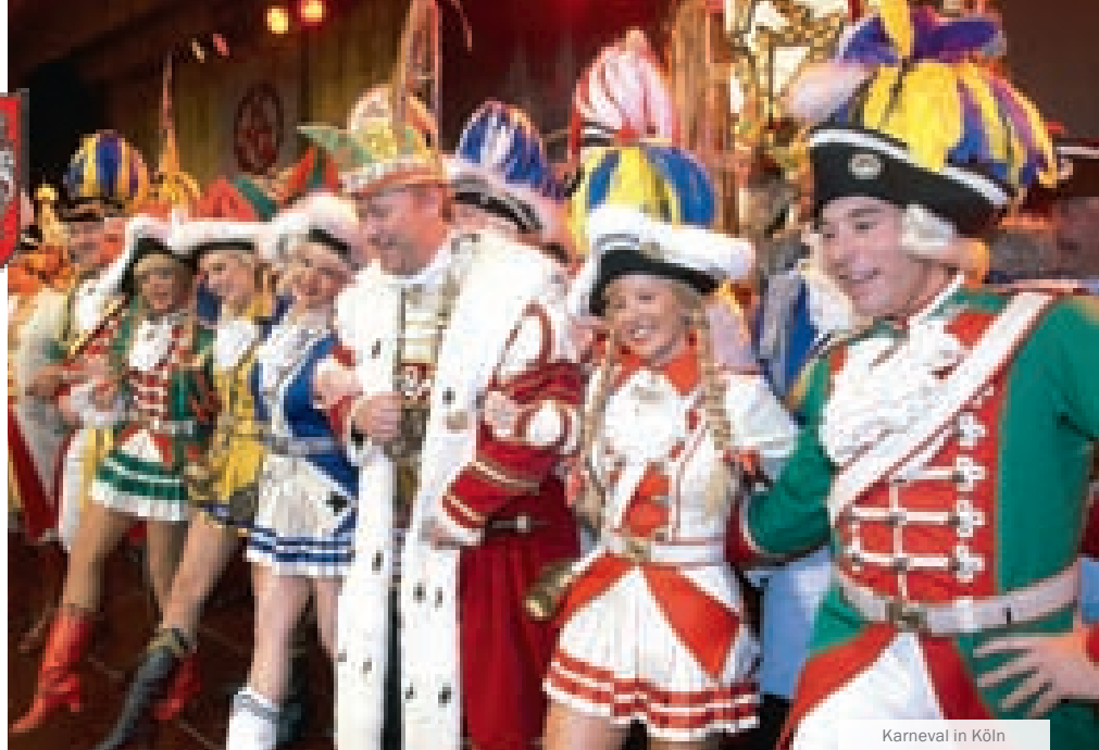
Karneval in Köln

burger Wald in Ostwestfalen-Lippe. Er gilt als „Heilgarten“ Deutschlands. Man kann dort eine Kur machen und wandern. Das Münsterland im Norden NRWs gilt als Fahrradland. Rund um die Stadt Münster gibt es fast 5000 Kilometer Radwege. Münster ist eine traditionelle Universitätsstadt mit einer lebendigen Kultur-, Musik- und Kneipenszene. Im Süden NRWs liegen zwei Mittelgebirge: links des Rheins ist die Eifel, rechts das rheinische Schiefergebirge mit dem Bergischen Land und dem Sauerland.