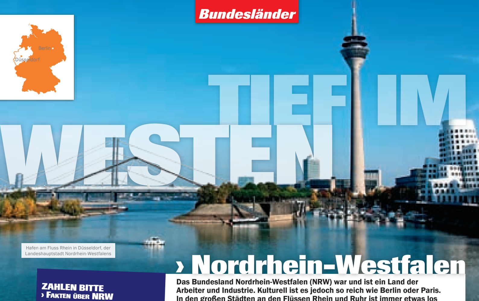
Hafen am Fluss Rhein in Düsseldorf, der Landeshauptstadt Nordrhein-Westfalens